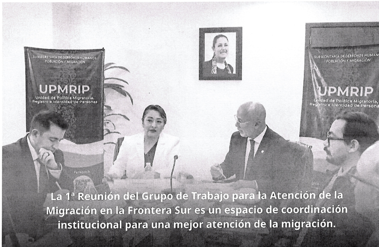
La 1ª Reunión del Grupo de Trabajo para la Atención de la Migración en la Frontera Sur es un espacio de coordinación institucional para una mejor atención de la migración.